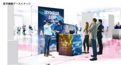
※ブースのイメージ

※ エントリー時に、最大2ブース希望することも可能です。上記サイズ×2箇所分となります。 ただし、応募多数の場合はご希望に添えない場合もございます。