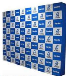
バックボードクロス (布のみ) 1,800×1,800mm

ブース装飾：バックボードやテーブルクロス、椅子カバー等、のぼり等のブース装飾をご希望の方は、以下の業者へ直接ご相談下さい。 (装飾費用は、全て自社でのご負担となります。)