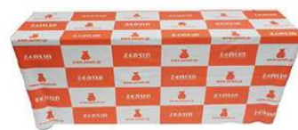
テーブルクロス (布) 1,800×1,500mm