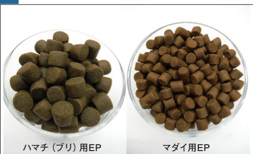
ハマチ (ブリ) 用EP

製造部では、生産計画を営業とやり取りしながら作成しており、即日対応などの変更も多く、個人の力に寄るところがほとんどです。システムが分担できる作業部分が増えれば、岩永の負担が減ります。生産計画が属人化し、1人に作業が集中する現状を改善した