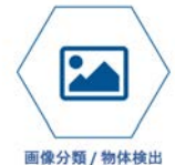
画像分類 / 物体検出