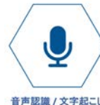
音声認識 / 文字起こし