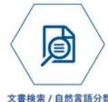
文書検索 / 自然言語分類